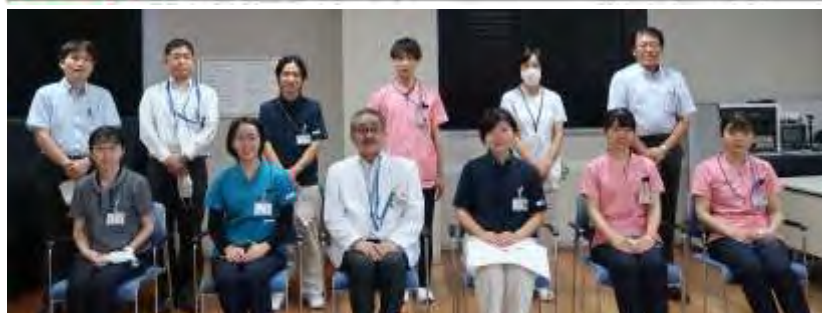
コンテスト表彰式 ※撮影時だけマスクをはずしています