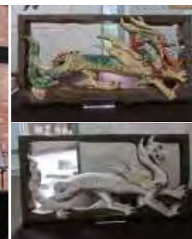
私も出品しました キトラ古墳 青龍と白虎