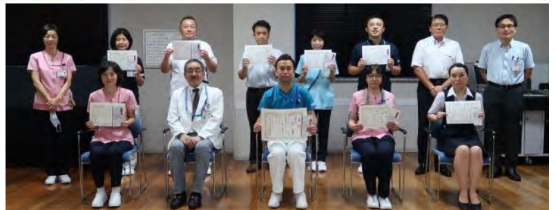
※間隔をあけて、撮影時だけマスクをはずしています