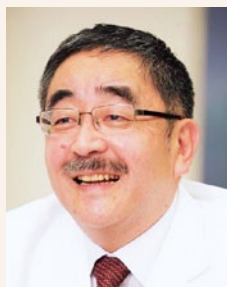
鶴巻温泉病院 院長