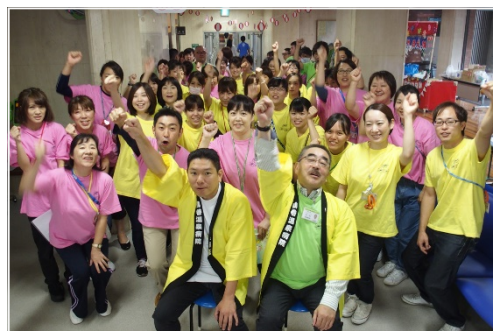
コスモス祭実行委員 団結式

参加された方々からは、「久しぶりに父の笑顔が見られて嬉しかった」や「誰もが参加できる楽しく温かいコスモス祭を今後も続けていただきたい」など、私達の方が嬉しくなるようなお声をいただくことができました。