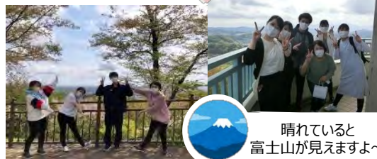
晴れていると富士山が見えますよ～