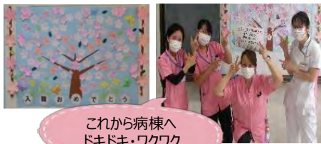
これから病棟へドキドキ・ワクワク

今春、看護部では新たに24人の新入職員を迎えることができました。看護師16名、介護福祉士6名、メディカルアシスタント2名のみなさまです。入職時研修は新型コロナウイルスの感染対策を実施しながら開催し、今年は弘法山へハイキングでチームワークを学ぶことができました。フレッシュのみなさんは「疲れた～」とは言いつつも表情は晴れやかでしたが、付添人として一緒に歩いた私はヘトヘト。また、初めて病棟へ向かうときは緊張している表情でしたが、病棟をラウンドしていると先輩について一生懸命学んでおり、共有ファイルを見ると日々の成長を感じます。共に育ち合っていきますよう、どうぞよろしくお願いいたします。