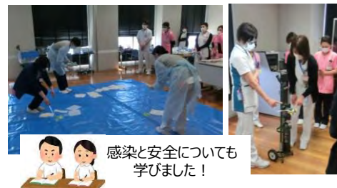
感染と安全についても学びました！