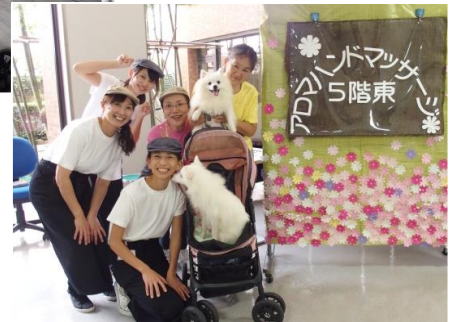
↑セラピードッグのヒメちゃん モモちゃんもお手伝い