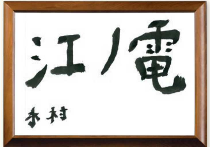
書 4階西病棟 木村 信明 様