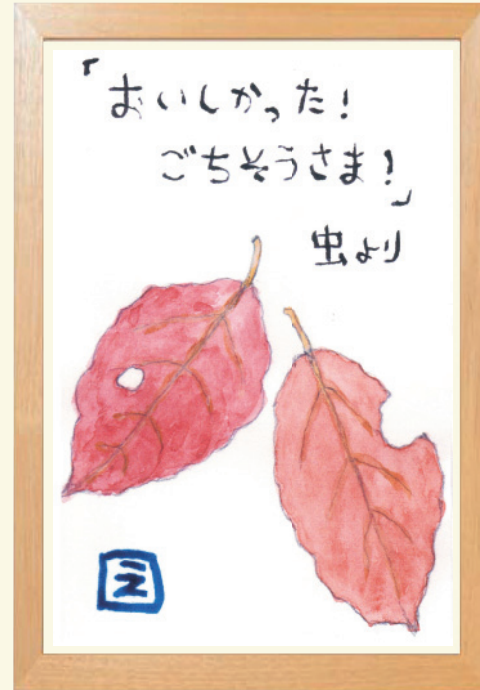
画 2 南山田 英司 様 心を込め一生懸命描きました。